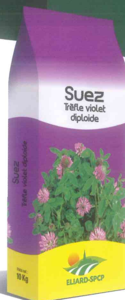
Sacherie 10 kg