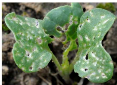
Dégâts d'altises sur cotylédons de colza