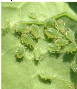
Pucerons verts

Des pyrèthrinoïdes simples permettent de contrôler efficacement la plupart des ravageurs d'automne sauf les pucerons qui nécessitent l'usage de produits plus haut de gamme comme le PROTEUS / ECAL par exemple.